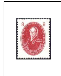
Wilhelm von Humboldt