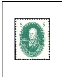
Alexander von Humboldt